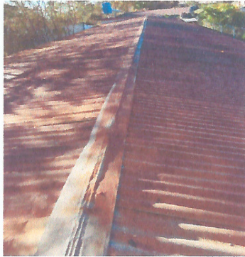
Mantenimiento de cubierta de techo.