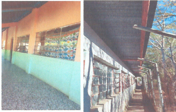
Mejoramiento de pintura en muros interior y exterior