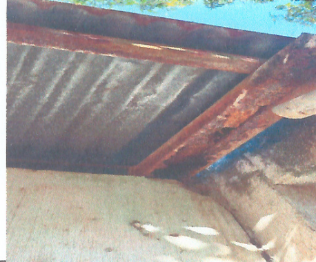
Mejoramiento de cubierta de techo.