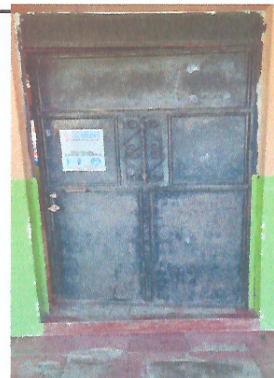
Mejoramiento de puertas.

Observación: Si es necesario se pueden agregar hojas adicionales y actualizar el número de hojas.